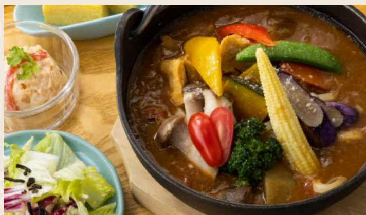
野菜カレーうどん 野菜咖哩烏龍麵 ..... 320 WIRED獨家蔬食咖哩醬汁濃而不膩 加入多種色彩豐富野菜煮製，使口感雙倍鮮甜