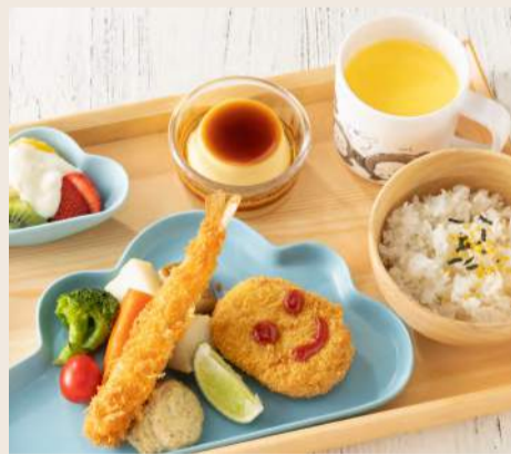
キッズエビフライコロッケプレート 炸蝦可樂餅兒童套餐 . . . . . 220