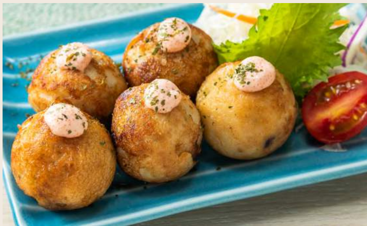
明太子タコ焼き 明太子章魚焼 ..... 220