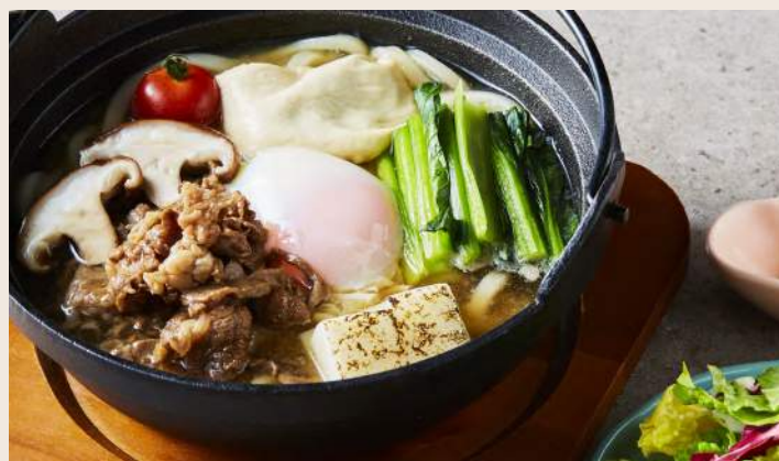
すき焼き風牛肉うどん 壽喜燒風牛肉烏龍麵 ..... 360 壽喜燒風味嫩煮的牛肉搭配經典日式高湯 清爽零負擔