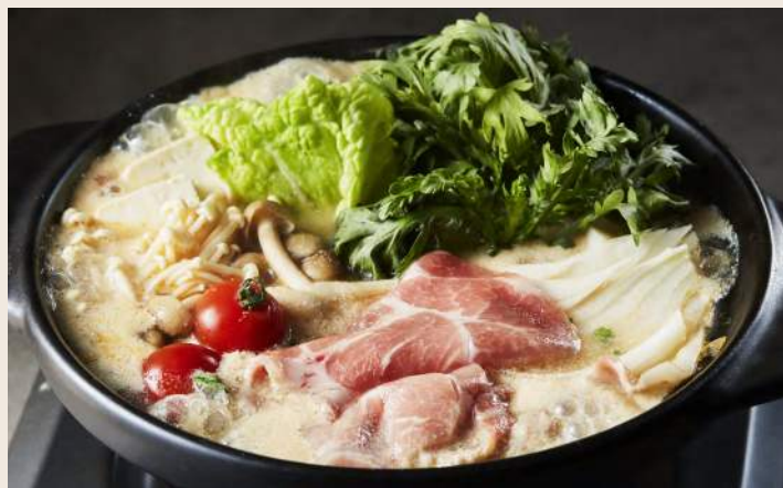
豚肉のトマト豆乳鍋 蕃茄豆乳豬肉個人鍋 429

WIRED CHAYA 提案 風味絕妙的特製豆乳湯底搭配蕃茄基底 看似衝突卻又和諧的結合 是茶屋強勢推出的人氣鍋品