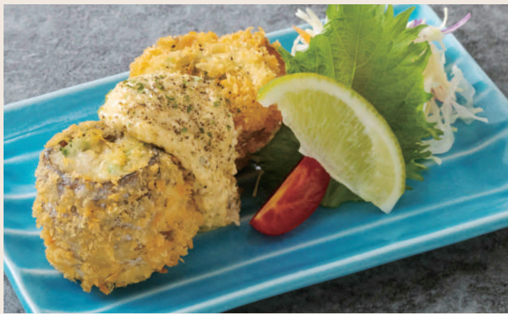
太刀魚大葉巻き 塔塔醬太刀魚紫蘇捲 ..... 160