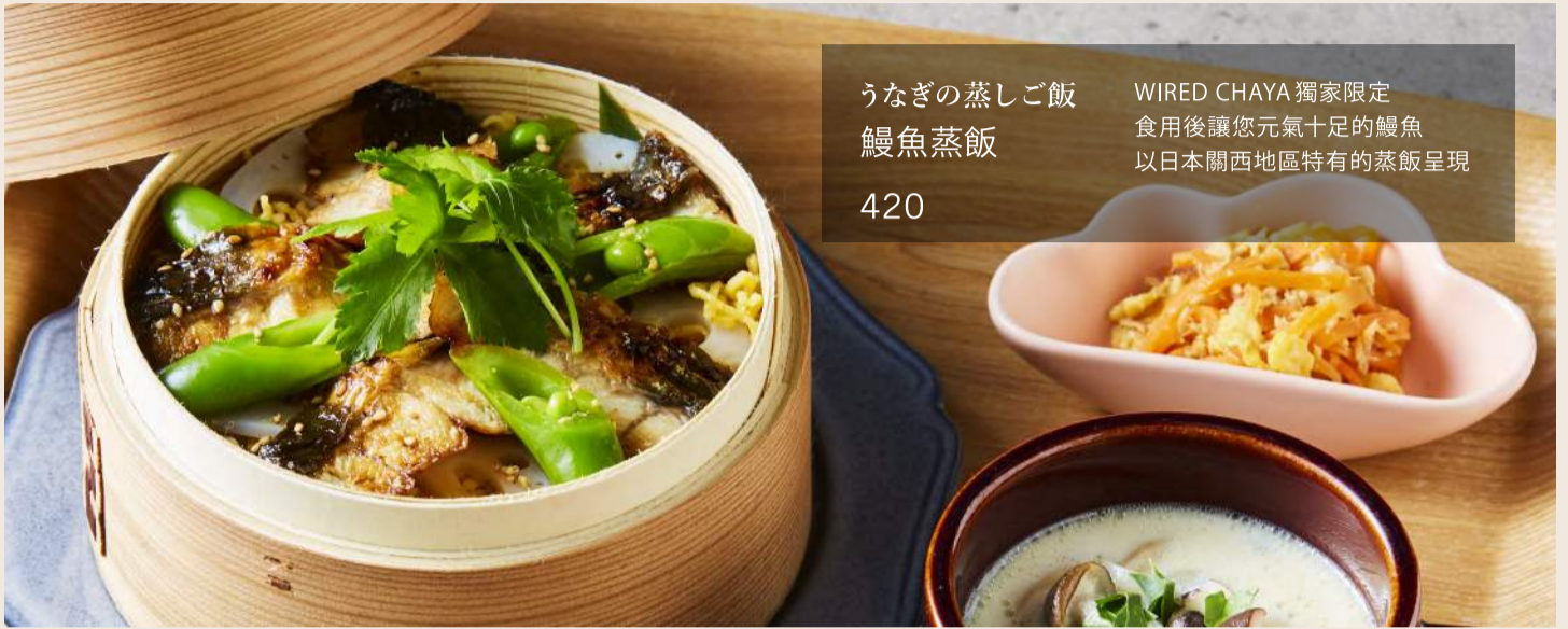
うなぎの蒸しご飯 鰻魚蒸飯 420 WIRED CHAYA 獨家限定 食用後讓您元氣十足的鰻魚 以日本關西地區特有的蒸飯呈現