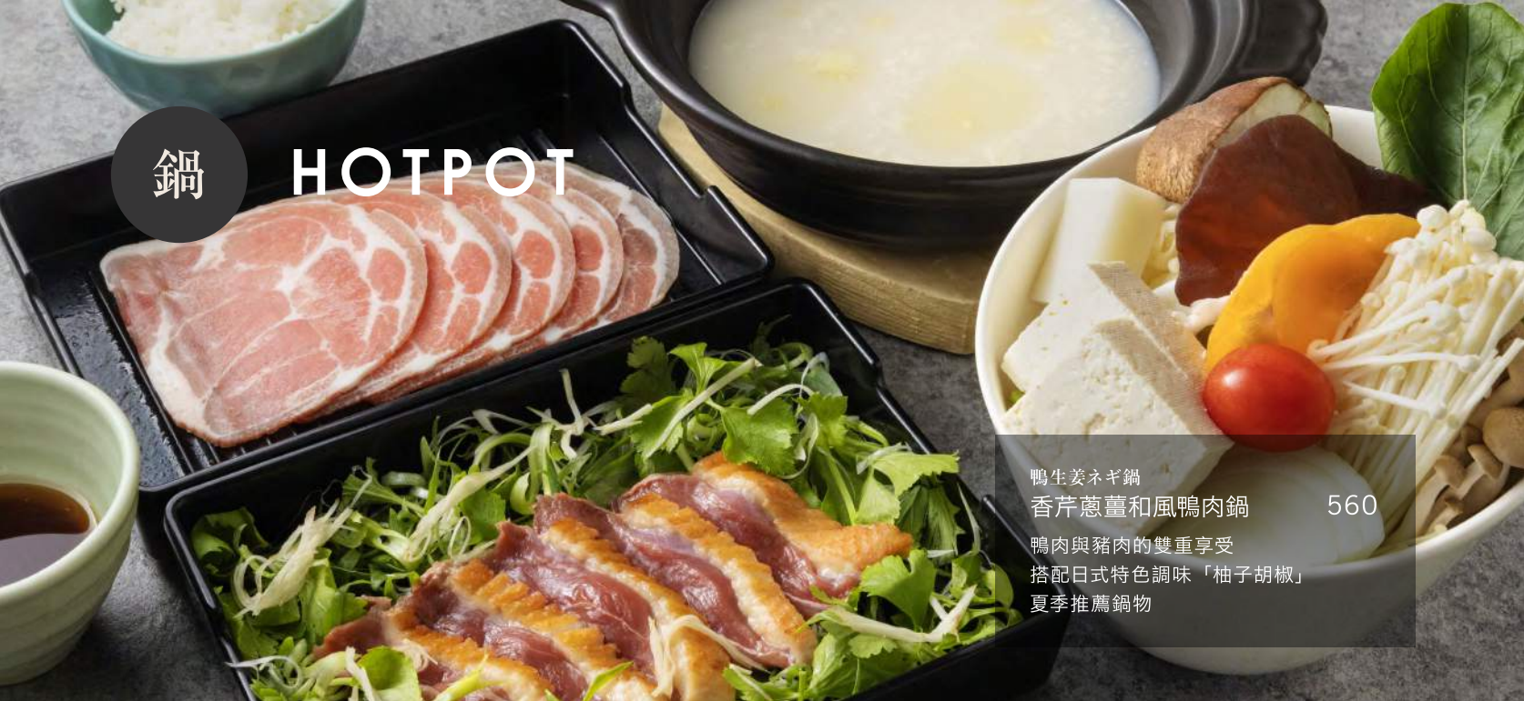
鴨生姜ネギ鍋 香芹蔥薑和風鴨肉鍋 560 鴨肉與豬肉的雙重享受 搭配日式特色調味「柚子胡椒」 夏季推薦鍋物