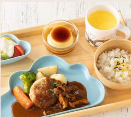
キッズハンバーグプレート 漢堡排兒童套餐 . . . . . 220