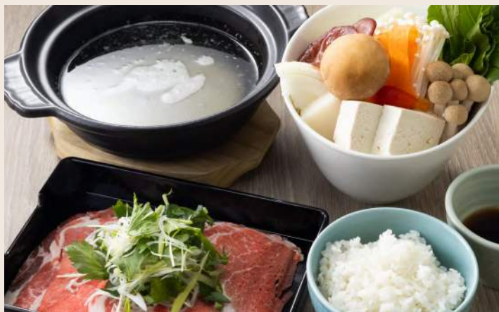
豚肉の雪見鍋 柚香胡椒雪見個人鍋 399

人氣日系特色調味「柚子胡椒」 作為高湯基底熬煮 清爽柚香襯托出食材最原始的甘甜滋味 淡麗口感使湯頭一入口暖胃也暖心