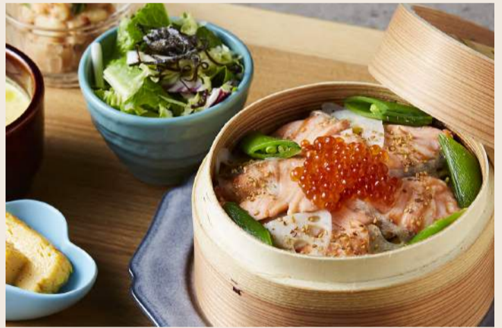
いくらと鮭の蒸しご飯 鮭魚親子蒸飯 . . . . . 380 源自日本關西風五目蒸飯 鮭魚與鮭魚卵的組合 豐富您口中的味蕾