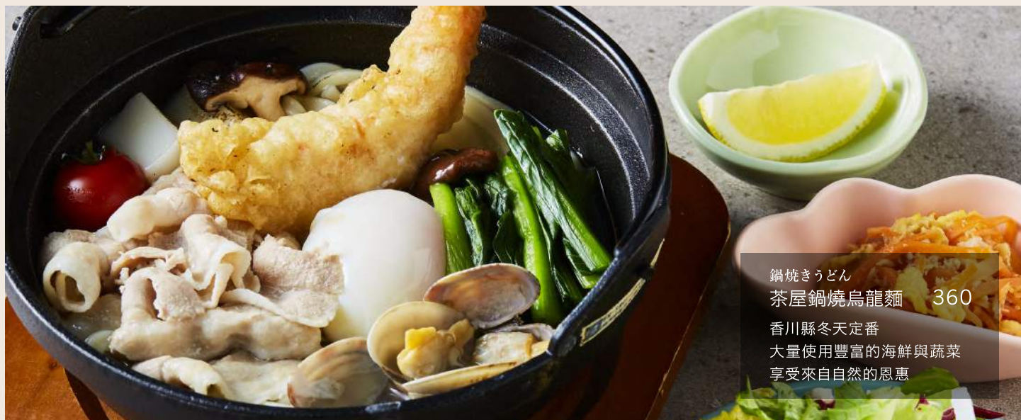
鍋焼きうどん 茶屋鍋焼烏龍麵 360 香川縣冬天定番 大量使用豐富的海鮮與蔬菜 享受來自自然的恩惠