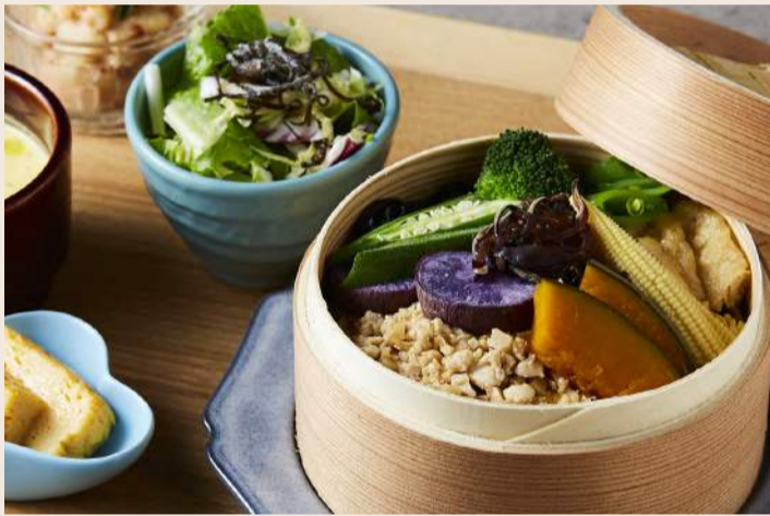
精進蒸しご飯 時蔬和風蒸飯 . . . . . 340 傳承京都百年的調味手法 豐富的野菜及特製竹筍豆腐香鬆 低卡食材的搭配健康美味無負擔