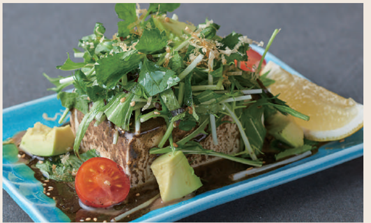
豆腐の冷奴 黒ごまソース 黑芝麻日式涼拌豆腐 ..... 160