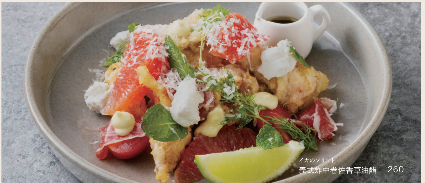
イカのフリット 義式炸中巻佐香草油醋 260