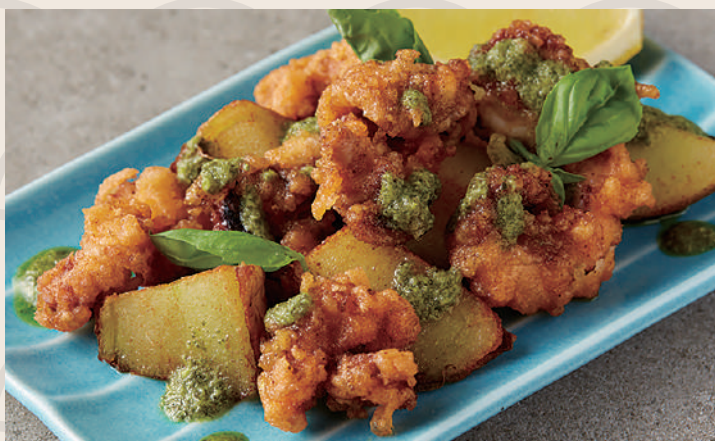
タコと芋のから揚げ バジルソース 日式炸章魚 佐蘿勒醬 ..... 160