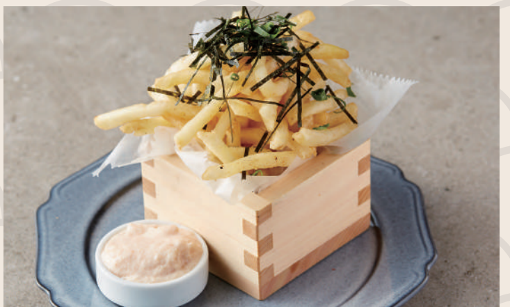
フライドポテト明太ソース 明太子炸薯條 ..... 160