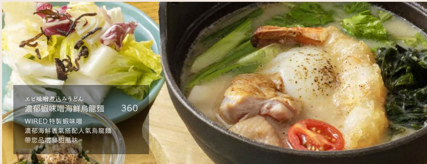
エビ味噌煮込みうどん 濃郁蝦味噌海鮮烏龍麵 360 WIRED特製蝦味噌 濃郁海鮮香氣搭配人氣烏龍麵 帶您品嚐鮮甜風味