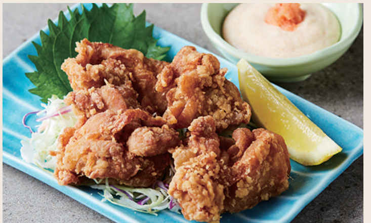
鶏もも肉の唐揚げ 明太子ソース 日式炸雞 佐明太子醬 ..... 240