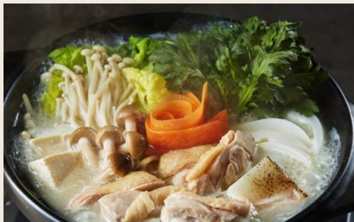
鶏肉の水炊き鍋 雞白湯野菜個人鍋 429

人氣日系特色調味「柚子胡椒」 作為高湯基底熬煮 清爽柚香襯托出食材最原始的甘甜滋味 淡麗口感使湯頭一入口暖胃也暖心