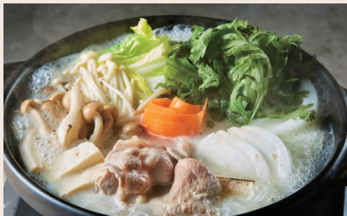
福岡博多豚骨鍋 福岡博多豚骨個人鍋 429

WIRED CHAYA 提案 風味絕妙的特製豆乳湯底搭配蕃茄基底 看似衝突卻又和諧的結合 是茶屋強勢推出的人氣鍋品