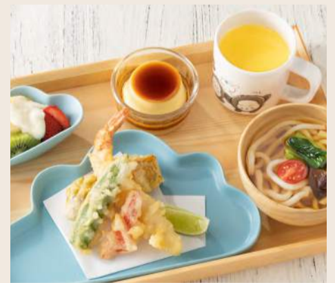
キッズ天ぷらうどん 天婦羅烏龍麵兒童套餐 . . . 220